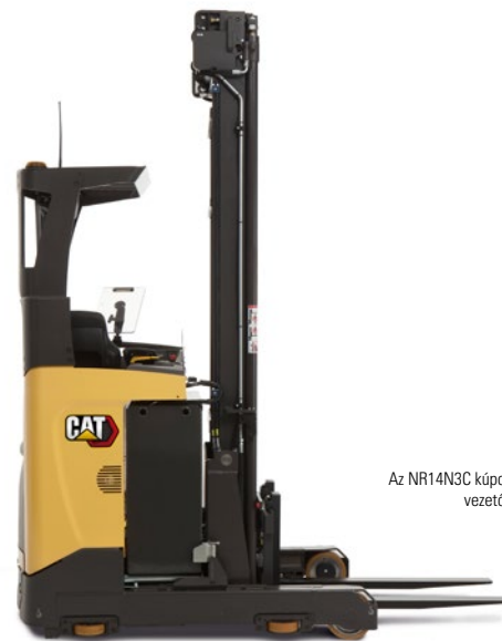
Az NR14N3C kúpos felső védőkerettel és vezetősín opcióval ábrázolva.

A LEGSZŰKEBB FOLYOSÓKHOZ A CAT® TOLÓOSZLOPOS TARGONCÁINAK LEGKOMPAKTABB KIVITELÉT AJÁNLJUK. EZEK A GAZDASÁGOS, KIS VAGY KÖZEPES IGÉNYBEVÉTELRE TERVEZETT TÍPUSOK AKÁR 7,25 MÉTERES EMELÉSI MAGASÁGGAL RENDELKEZNEK ÉS JÓ MANŐVEREZŐ KÉPESSÉGET, HATÉKONY TELJESÍTMÉNYT ÉS TELJES KÖRŰ CAT MINŐSÉGET KÍNÁLNAK.