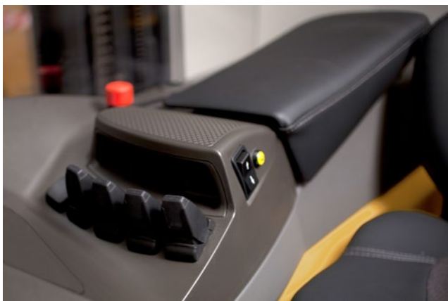
Ujjheggyel irányítható hidraulikus kezelőszervek opció.