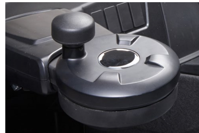
Opcionális midi kormánykerék.