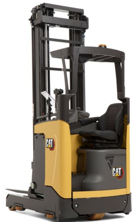
Az NR14N3C kúpos felső védőkerettel és vezetősín opcióval ábrázolva.