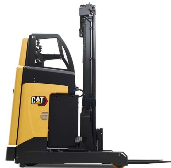
Optionale beheizte Kabine mit abgeschrägtem Fahrerschutzdach.