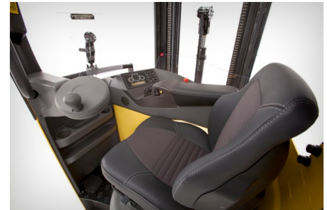
Abgebildet ist ein Innenraum mit Midi-Lenkradoption.