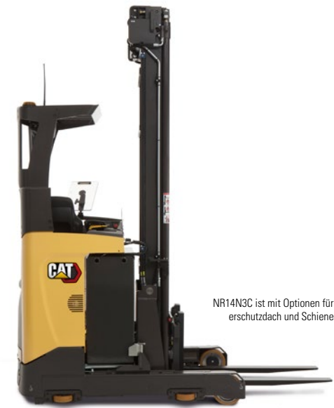
NR14N3C ist mit Optionen für abgeschrägtes Fahrerschuttdach und Schienenführung abgebildet.

IN EXTREM SCHMALEN GÄNGEN HILFT IHNEN DER KOMPAKTESTE DER CAT® SCHUBMASTSTAPLER. ER BIETET SPARSAME UND LEICHTE MODELLE MIT MITTLERER TRAGKRAFT UND HUBHÖHEN VON BIS ZU 7,25 METERN, DIE SICH DURCH EXTREME MANÖVRIERBARKEIT, EFFIZIENTE LEISTUNG UND DIE GANZE QUALITÄT VON CAT AUSZEICHNEN.