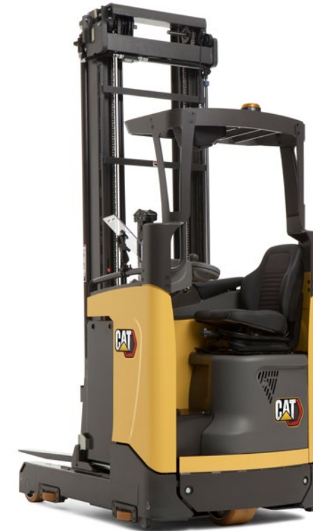
NR14N3C ist mit Optionen für abgeschrägtes Fahrerschutzdach und Schienenführung abgebildet.

info@catliftruck.com | www.catliftruck.com