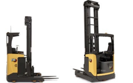
Wózki wysokiego składowania: udźwig 1,2–2,5 tony