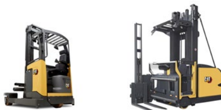
Czterokierunkowe wózki widłowe wysokiego składowania: udźwig 2,0–2,5 tony