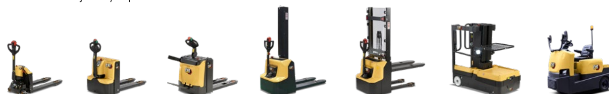
EQ Line: 0,38 – 6,0 tony