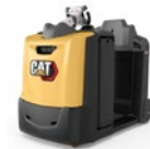
Wózki holownicze: udźwig 3,0–5,0 ton