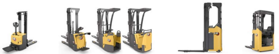
Wózki do niskiego składowania: udźwig 1,0–2,0 tony