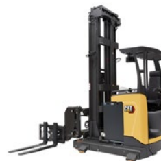
Wózki VNA typu „man-down”: udźwig 1,3–1,5 tony