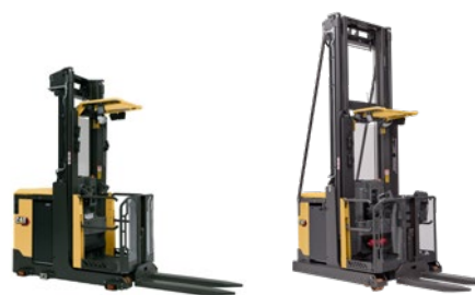
Wózki do kompletacji zamówień: udźwig 1,0–2,5 tony