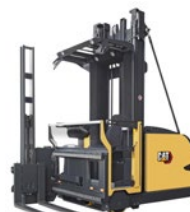
Carrelli trilaterali man-up: portata 1.1 – 2.0 t