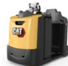
Veicolo elettrico per traino: portata 3.0 – 5.0 t