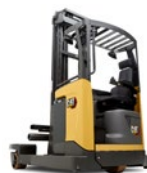
Carrelli Retrattili Quadri-Direzionali: portate 2.0 & 2.5 t