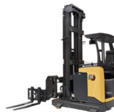
Carrelli Man-Down Vna: portata 1.3 – 1.5 t