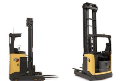
Gamma di carrelli elevatori retrattili: portate 1.2 – 2.5 t