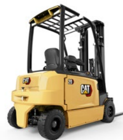
Gamma elettrica: portate 1.4 – 5.5 t