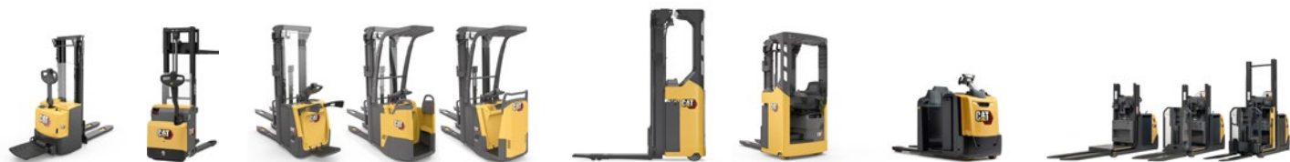
Gamma di stocicatori: portate 1.0 – 2.0 t