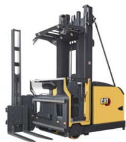
Carrelli trilaterali man-up: portata 1.1 – 2.0 t