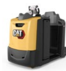
Veicolo elettrico per traino: portata 3.0 – 5.0 t