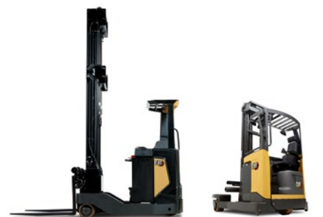
Carrelli retrattili multi-direzionali / Carrelli Retrattili Quadri-Direzionali: portate 2.0 & 2.5 t