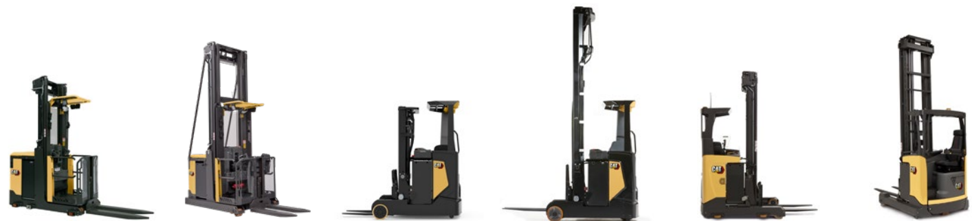
Gamma di carrelli elevatori retrattili: portate 1.2 – 2.5 t