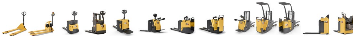
Gamma di transpallet: portate 1.2 – 2.5 t