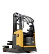
Chariots multidirectionnels : 2,0 à 2,5 tonnes