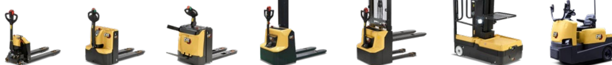
EQ Line: 0,38 à 6,0 tonnes