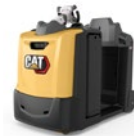
Tracteur : 3,0 à 5,0 tonnes