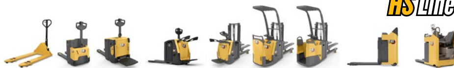
Gamme de transpalettes électriques : 1,6 à 2,5 tonnes

Nos chariots de la gamme EQ Line réunissent tout ce dont vous avez besoin pour une manutention de matériaux fiable et accessible avec, en prime, une configuration simple et intuitive. Idéale pour des applications peu intensives, avec une utilisation légère ou occasionnelle.