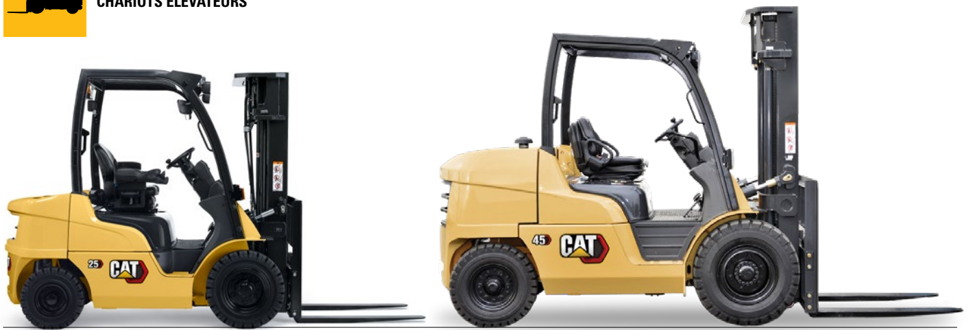
Gamme diesel : capacité de 2,0 à 10,0 tonnes