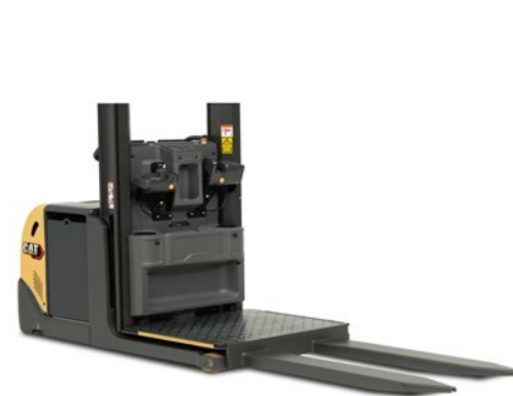
NOL10P elevación de plataforma 1200mm.

MEJORE SU EFICIENCIA Y PRODUCTIVIDAD CON ESTE RECOGEPEDIDOS DE MEDIO NIVEL Y SUS OPCIONES. SELECCIONE UNA PLATAFORMA ELEVADORA DE 1,2 Ó 1,8 M PARA TENER UN ACCESO RÁPIDO Y FÁCIL CON UNA ALTURA DE RECOGIDA DE 2,8 Ó 3,4 M EN CUALQUIER LUGAR.