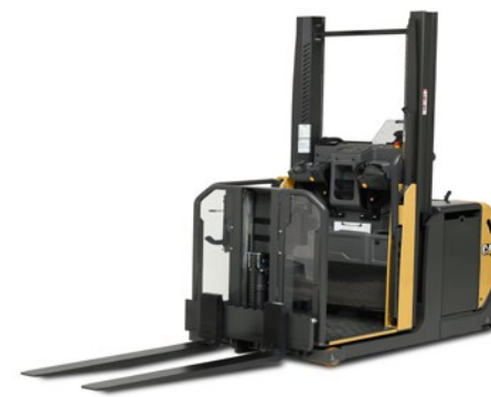
NOL10P elevación de plataforma 1800mm.