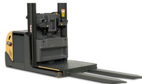
NOL10P 1200mm sollevamento pedana.

MIGLIORATE L'EFFICENZA E LA PRODUTTIVITÀ GRAZIE A QUESTO CARRELLO COMMISSIONATORE PER IL SECONDO LIVELLO DI PRELIEVO E ALLE SUE CARATTERISTICHE. LA SUA PEDANA ELEVABILE DA 1.2 O 1.8 M, CHE PERMETTE UN ACCESSO FACILE E VELOCE PER PRELEVARE IN QUASIASI POSIZIONE FINO A 2.8 O 3.4 M.